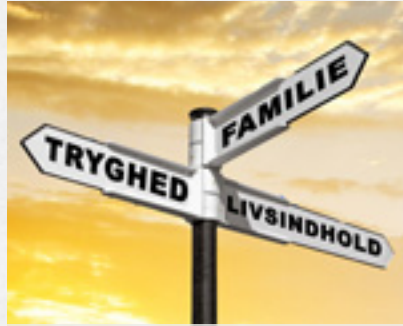
VEJLEDNING & OVERBLIK